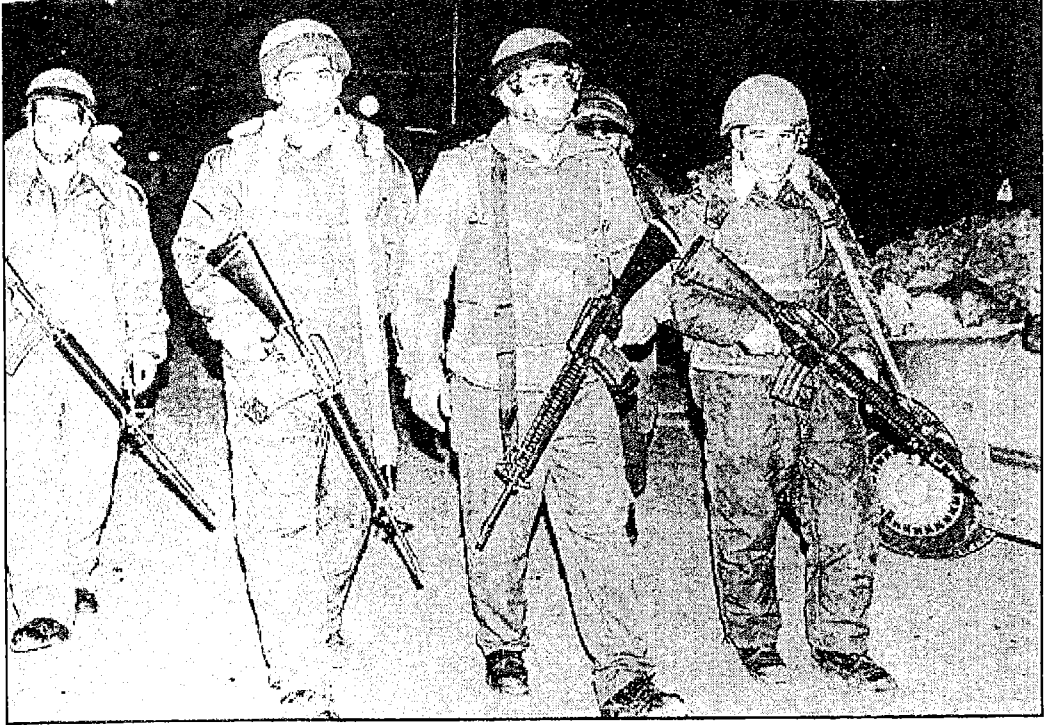
جنود إسرائيل .. أتباع الشيطان